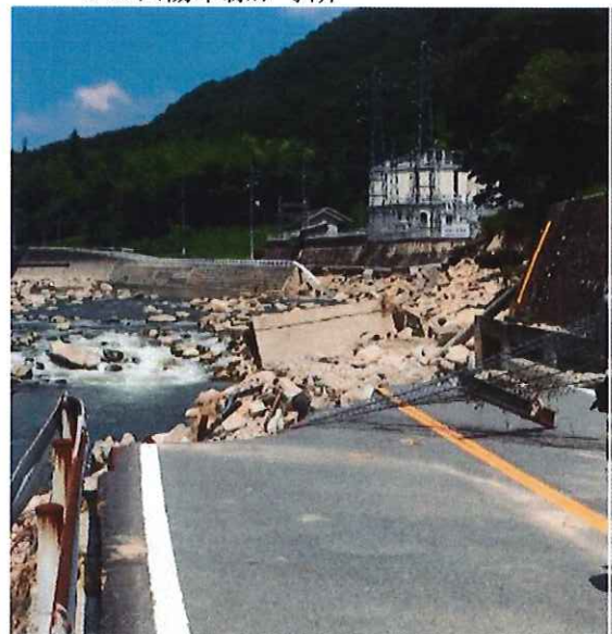
沼田川沿いを通る県道が寸断