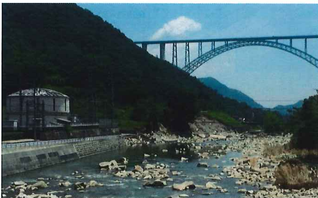
広島空港大橋の下を流れる沼田川が氾濫