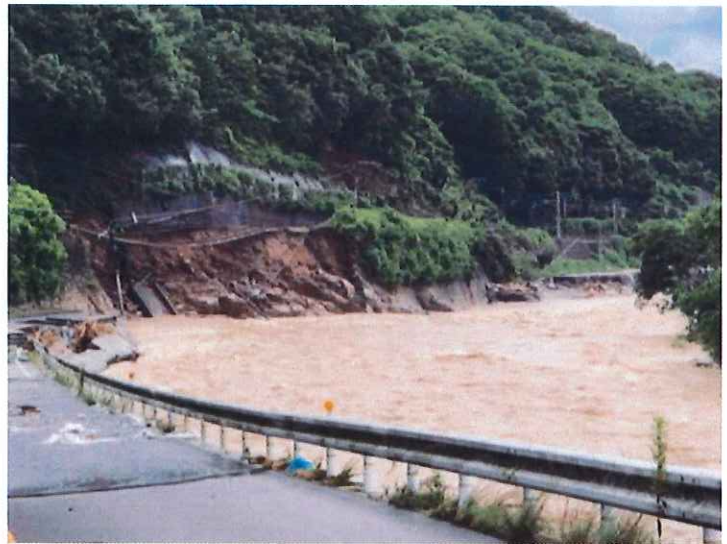
J R 山陽本線が寸断