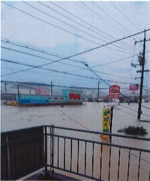
本郷下北方 商業施設や民家すべてが水没